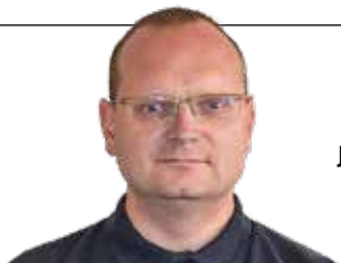
Jiří Mikuláš starosta města Oloví