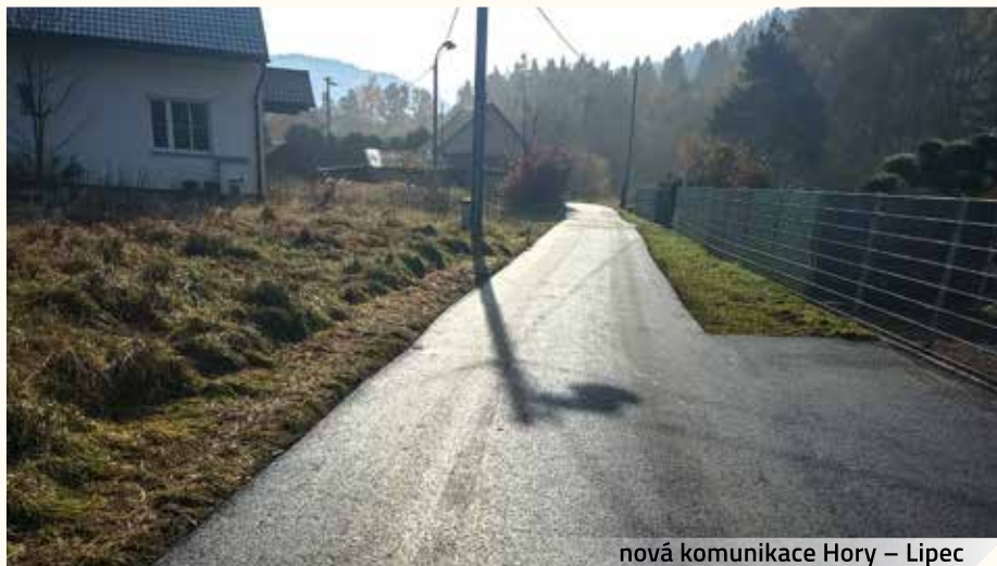
nová komunikace Hory – Lipec

V září letošního roku byla opravena komunikace v místní části Hory – Lipec. Náklady na opravu této komunikace byly v celkové výši 1.683.436 Kč.