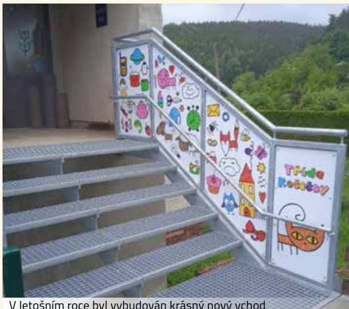
V letošním roce byl vybudován krásný nový vchod